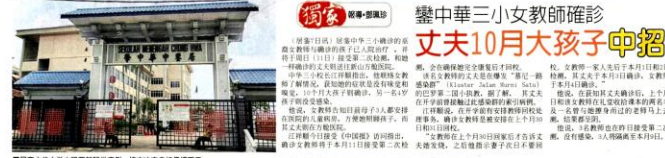
■鑿中華三小女教師確診肺炎，校方決定自行停課兩天。