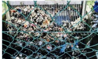
沙曼拉路及苏丹娜路交界处的地下排水卷闸失灵，深深影响峇市的排水系统。

一、一条国能公司弃用的旧电缆掉落在水面，卡住大量垃圾，造成排水系统失调，满急流水才会向四面八方倒流，一发不可收拾。