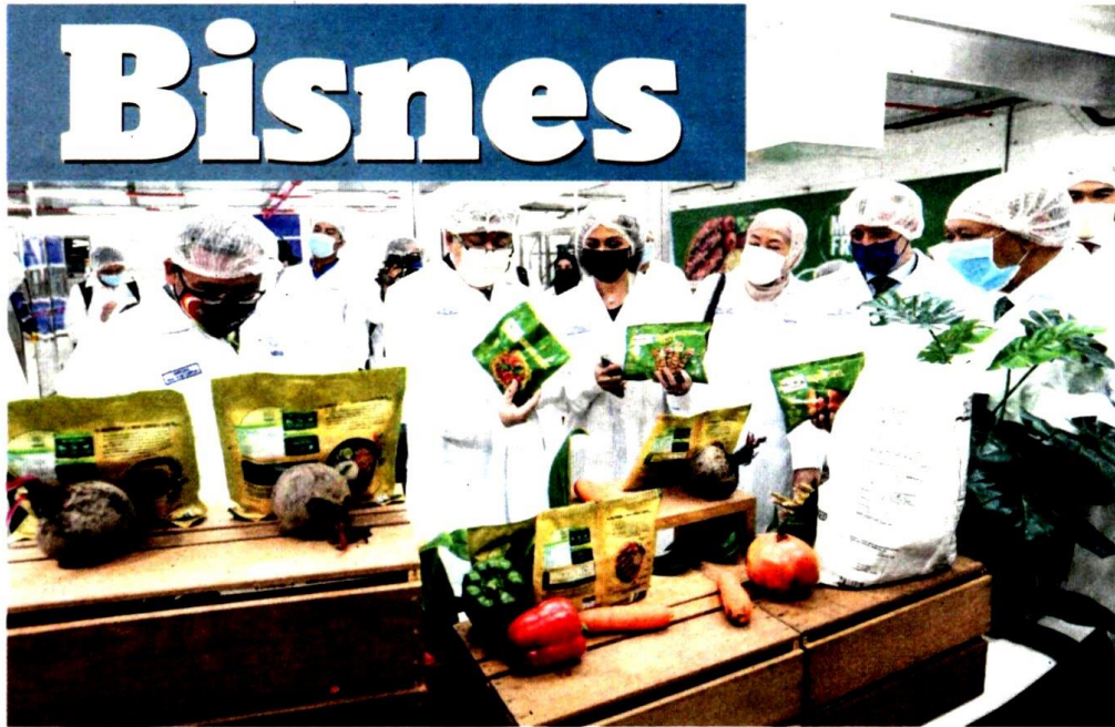
SULTAN Sharafuddin diiringi Tengku Permaisuri Norashikin berkenan melihat produk Nestle PBMS, semalam.