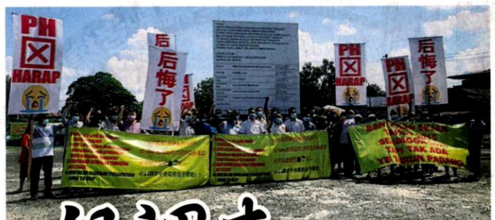
■居民再次拉横幅反对在家前建庙。