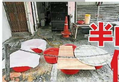
一些商家只是在數個大水盆里儲水。