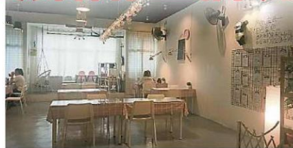
为营造卫生、健康及舒适用餐环境，沙亚南市政厅推出“ I-Gred ”手机应用程序，让消费者在用餐完毕后，给该餐厅各方面评分。

为了营造卫生、健康及舒适的用餐环境，沙亚南市政厅今日推出“ I-Gred ”手机应用程序，让消费者在用餐完毕后，给该餐厅各方面评分。