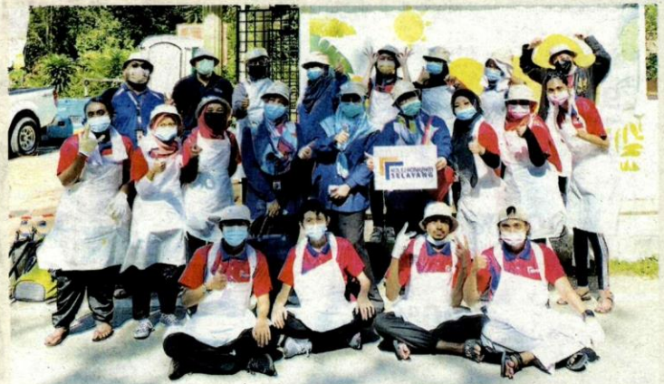
PELAJAR bersama pensyarah Sijil Rekabentuk Dalaman Kolej Komuniti Selayang yang terlibat untuk lukisan mural di Gombak baru-baru ini.

Program anjuran bersama Jabatan Pengairan dan Saliran (JPS) Daerah Gombak itu bertujuan memberi kesedaran kepada rakyat Malaysia mengenai krisis air dan kepentingan air dalam kehidupan seharian.