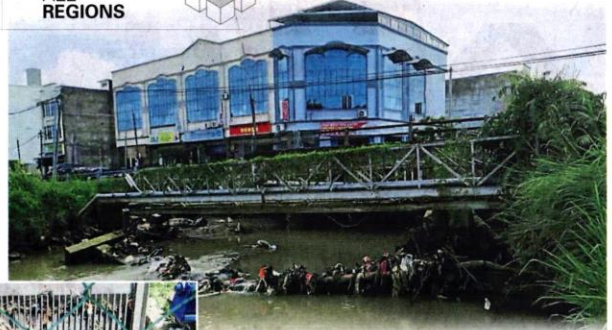
国能公司弃用的旧电缆掉落在巴力罗比水面，卡住大量垃圾，令排水失调。

他促请市议会扮演协调角色，与公共工程局、水利灌溉局、县属、国能公司等相关机构迅速展开检讨会议，一同寻求对策，同时，他也呼吁各区域国会议员为民请命，寻求中央