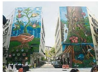
就永续性发展目标, 安邦坊附近的后巷被画上巨型壁画。