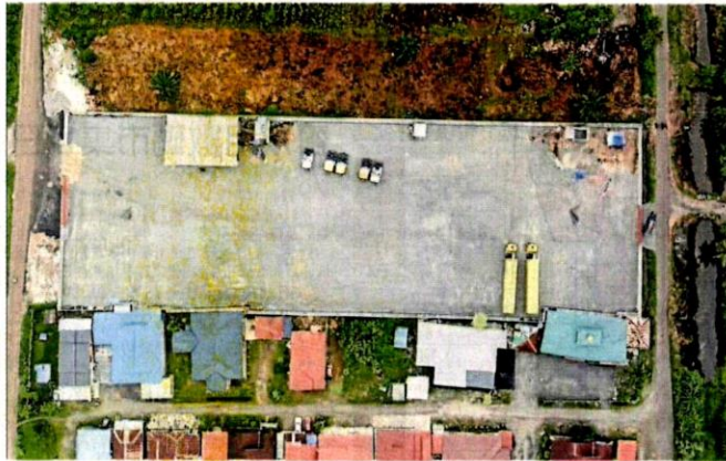
土地局出动无人机航拍，以便视察仓库的内部情况。