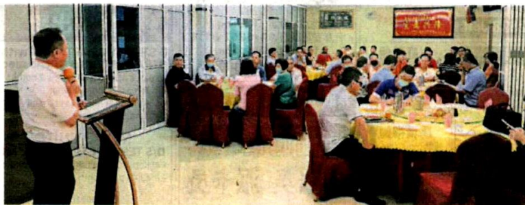
■适耕庄华团联谊会主办聚餐会，积极招募华团会员加入，以推广当地政经文教活动。

对此黄瑞林表示认同，并强调此举对正式获得社团注册地位的联谊会而言，是个重新出发的重要象徵，既能避免未来的活动，陷入挪用前朝款项之嫌，也能协助垦殖华小、育群华小和育群国民型中学办学。