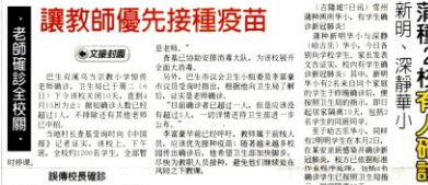
■鑿中所有教職員都進行消毒。