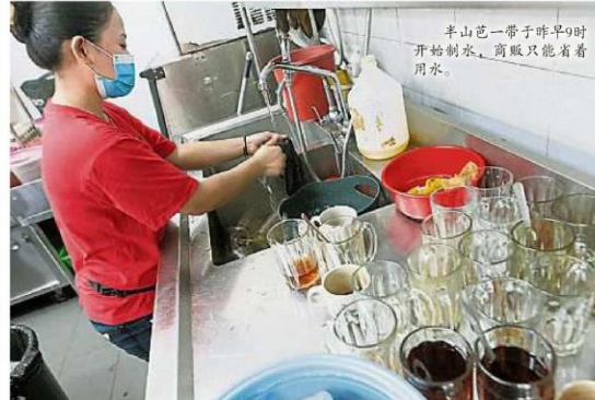
半山芭一帶子昨早9時開始制水，商販只能着着用水。