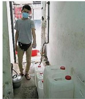
商家都已自行儲水，惟儲存的水量并不多。