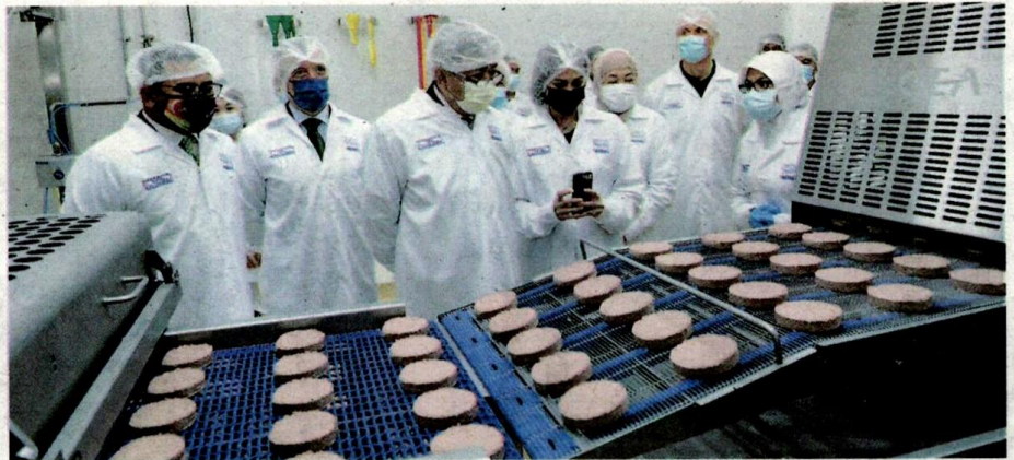
SULTAN Sharafuddin Idris Shah, Tengku Permaisuri Norashikin dan Tengku Amir Shah melihat proses pembuatan produk makanan di kilang PBMS Nestle Malaysia di Seksyen 15, Shah Alam, semalam.

berada di pasar raya dan kedai dalam masa beberapa bulan lagi,” katanya dalam sidang akhbar selepas majlis perasmian kilang pembuatan makanan berasaskan tumbuhan Nestle di Kompleks Perindustrian Nestle Malaysia di Seksyen 15 di sini, semalam.