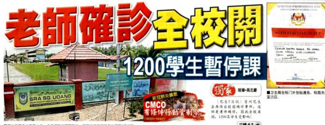
■巴生及馬六甲兩所小學一名老師確診新冠肺炎，目前學校已被關門至4月15日。