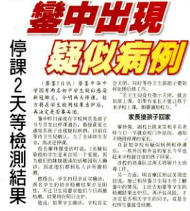
■鑿中出現疑似病例，校方決定自行停課兩天。