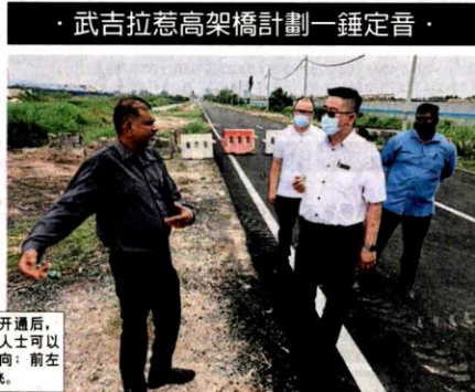
· 武吉拉惹高架橋計劃一錘定音 ·