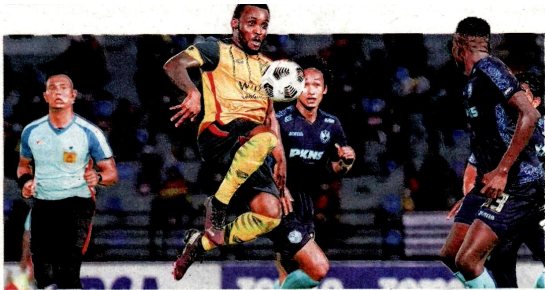
KIPRE (kiri) berjaya meledak gol kemenangan KDA FC ketika mereka mengecewakan Selangor FC 2-1 di Petaling Jaya kelmarin.