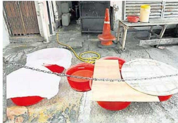
■半山芭一带于6日早上9时开始制水，一些商家在数个大水盆里储水。