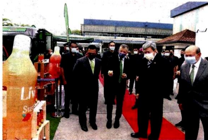
Sultan Selangor, Sultan Sharafuddin Idris Shah (dua dari kanan) berangkat merasmikan Pusat Pengeluaran Makanan Berasaskan Tumbuhan Nestle di Shah Alam pada Rabu.

“Pembukaan kilang ini membolehkan Nestle Malaysia membekalkan makanan berasaskan tumbuhan keluaran tempatan yang berkualiti tinggi,