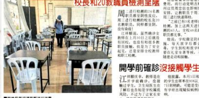
■鑿中所有教職員都進行消毒。